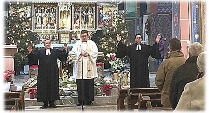
Ein gutes Team!